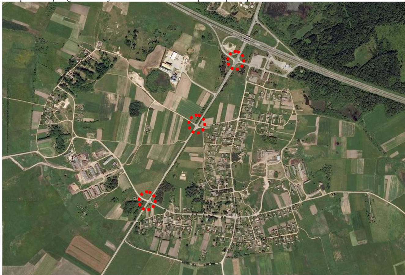
3.3.1 pav. IVR įrengimo Kalnujuose/Palendriuose konceptualūs principai